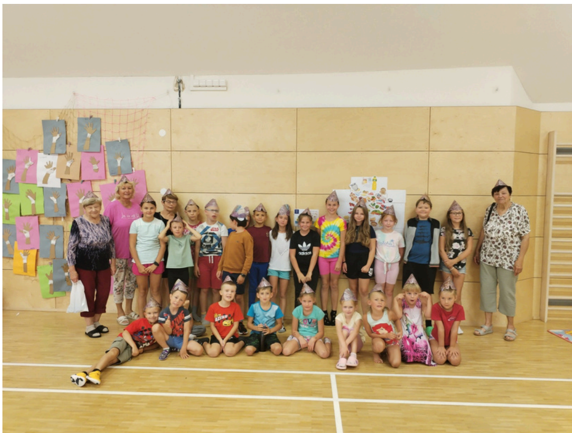
TVOŘILKY NA PŘÍMĚSTSKÉM TÁBOŘE