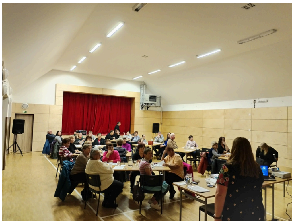
PŘEDNÁŠKA NÁRODNÍ TÝDEN TRÉNOVÁNÍ PAMĚTI